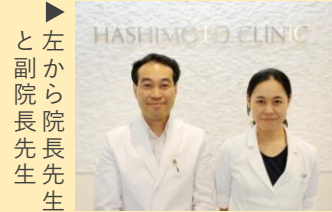
▶ 左から副院長先生